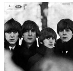
Die vier ernsten Gesichter auf dem Cover zur LP mit dem sarkastisch klingenden Titel BEATLES FOR SALE scheinen vom monatelangen Stress zu erzählen. Die Platte erschien am 4. Dezember 1964 in England.

Gegen Ende 1963 zeigte sich, dass die BEATLES in Großbritannien alles erreicht hatten, was unter diesen Umständen erreichbar war. Nach ihren erfolgreichen Live-Auftritten in Europa schauten sie auf Amerika als ihr nächstes und ultimatives Ziel. Gemessen an dem, was vorher war, übertraf der Umfang der amerikanischen Reaktion auf die BEATLES alle Erwartungen. Irgendwie schafften sie es, einen ganzen Kontinent zu verführen, einen Kontinent der von seiner eigenen Musikindustrie unumschränkt 50 Jahre lang beherrscht worden war. Die Beatlemania jagte durch die Vereinigten Staaten, den Weg bahrend für eine regelrechte Invasion britischer Musikgruppen.