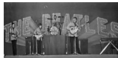
Die BEATLES während ihres Japanaufenthaltes vom 27. Juni bis 3. Juli 1966.