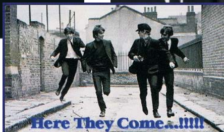
Die Fab Four in einer berühmten Szene aus dem Film A HARD DAY'S NIGHT , der zwischen dem 2. und 6. März 1964 gedreht wurde. RINGO STARR wurde für seine hervorragende Darstellung gelobt. Später spielte er in einigen weiteren Filmen mit, darunter in CANDY (1968), THE MAGIC CHRISTIAN (1970) und THAT'IL BE THE DAY (1973).