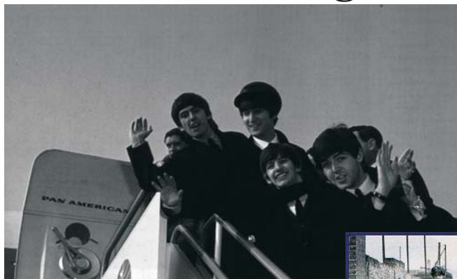
Ankunft der BEATLES zu ihrer ersten Amerikatour am 18. August 1964 in San Francisco.

Unter den vielen sozialen Faktoren, die den Erfolg der BEATLES in Amerika erklären, ist das Vakuum, das sich nach dem Tod des jungen Präsidenten Kennedy im November 1963 bildete, vielleicht einer der wichtigsten.