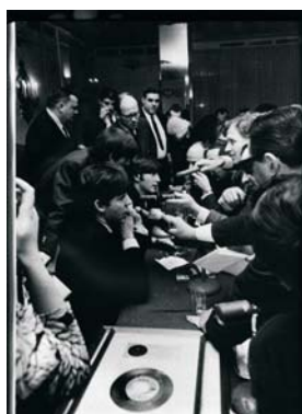
Die BEATLES zeigten sich auf Pressekonferenzen (wie hier am 10. Februar 1964 in New York) ausgesprochen witzig und freundlich. Das gute Verhältnis, das sie zur Presse entwickelten, trug viel zur Stabilisierung ihres sauberen Images bei.