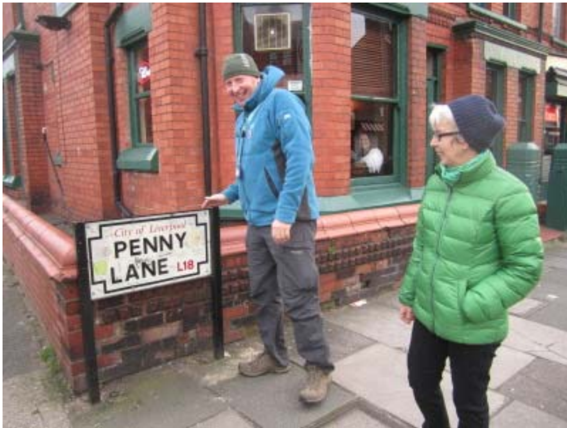
Foto: Phil Hughes kennt die Geschichte der Beatles genau und führt zu berühmten "places I remember all my life".