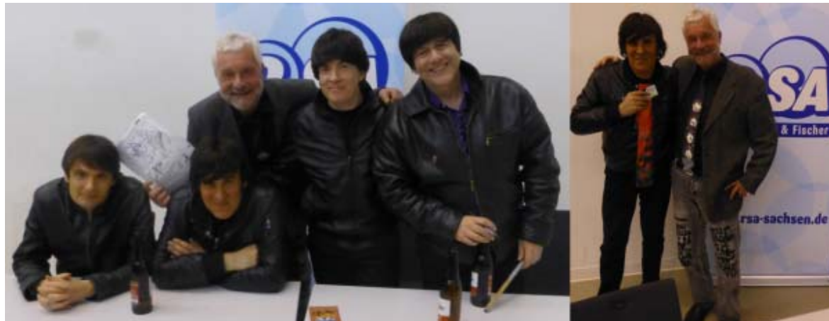
Fotos: Frank und seine Freunde, die SILVER BEATLES

Übrigens, das Konzert der SILVER BEATLES in Dresden war wieder super!! Auf zwei Positionen hatte JOHNNY neu besetzt: Drums und Bass!! Es gab viele Streitigkeiten, habe mich mit den Jungs nach dem Konzert lange unterhalten!! JOHNNY wollte sofort eine Krawatte von mir!! Motiv "Love Me Do"!!