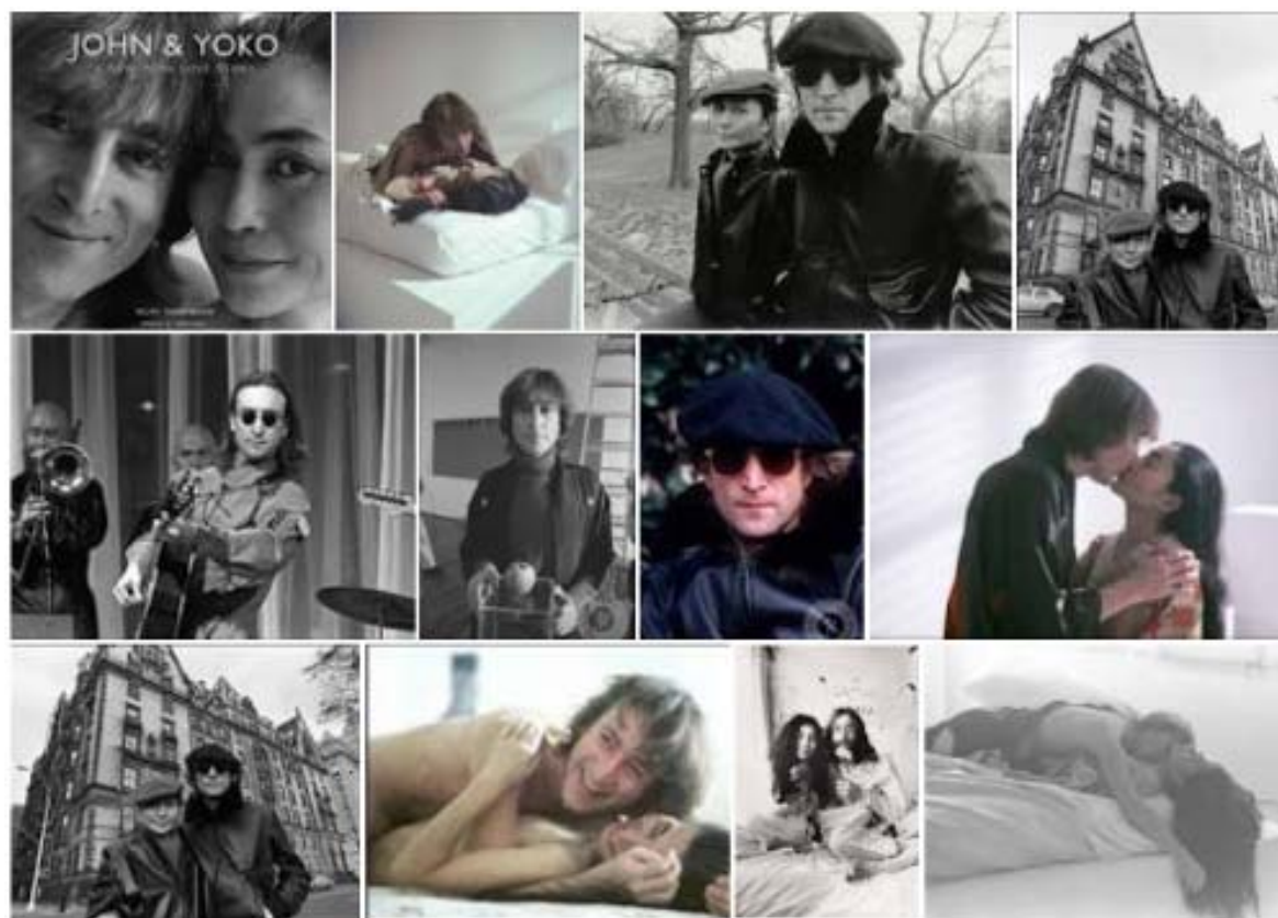
Abbildungen: links oben das Buch, ansonsten eine kleine Auswahl der Fotos.

Wir verpacken die originale Versandbox noch einmal, so dass Du das Buch in der Verpackung bekommst, wie es 2007 für den Versand vorgesehen war. Jedoch hat die originale Versandbox im Laufe der Jahre Gebrauchs- und Versandspuren.