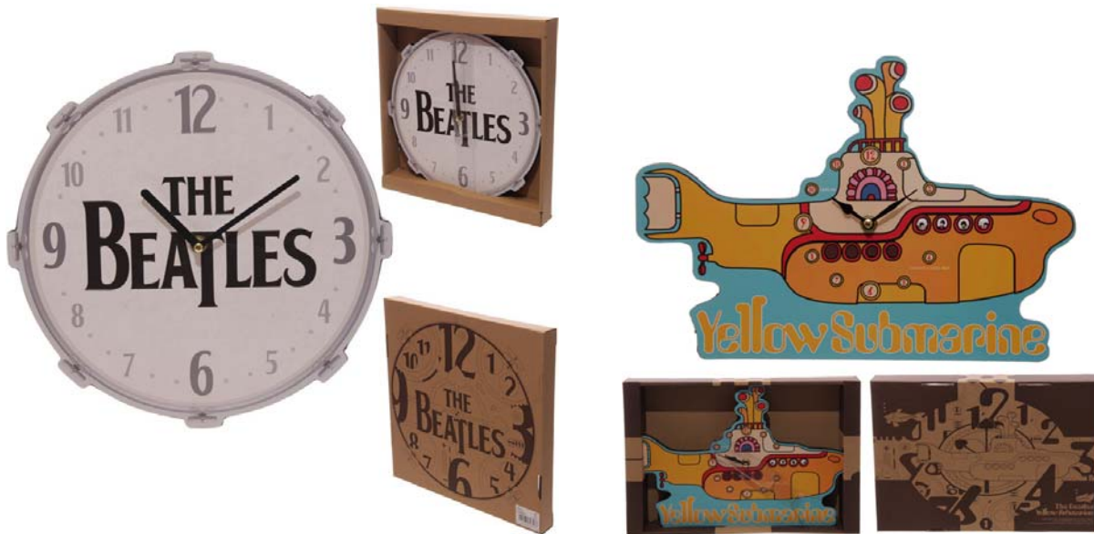
Abbildungen: Uhr; verkleinert Box-Vorder- und Box-Rückseite

2000er Jahre: BEATLES-Wanduhr THE BEATLES BASS DRUM. 14,90 Euro