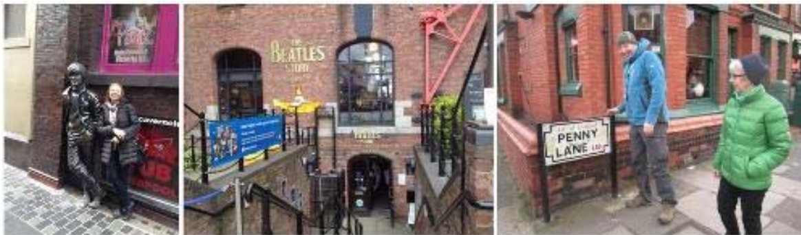
Foto links: Das kann sich keiner verkneifen: einmal in der Matthew Street neben John ...

SONDERPREISE FÜR M.B.M.s - bitte beim Veranstalter erfragen.