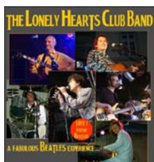
THE LONELY HEARTS CLUB BAND: ALLE KONZERTTERMINE (bitte anklicken)