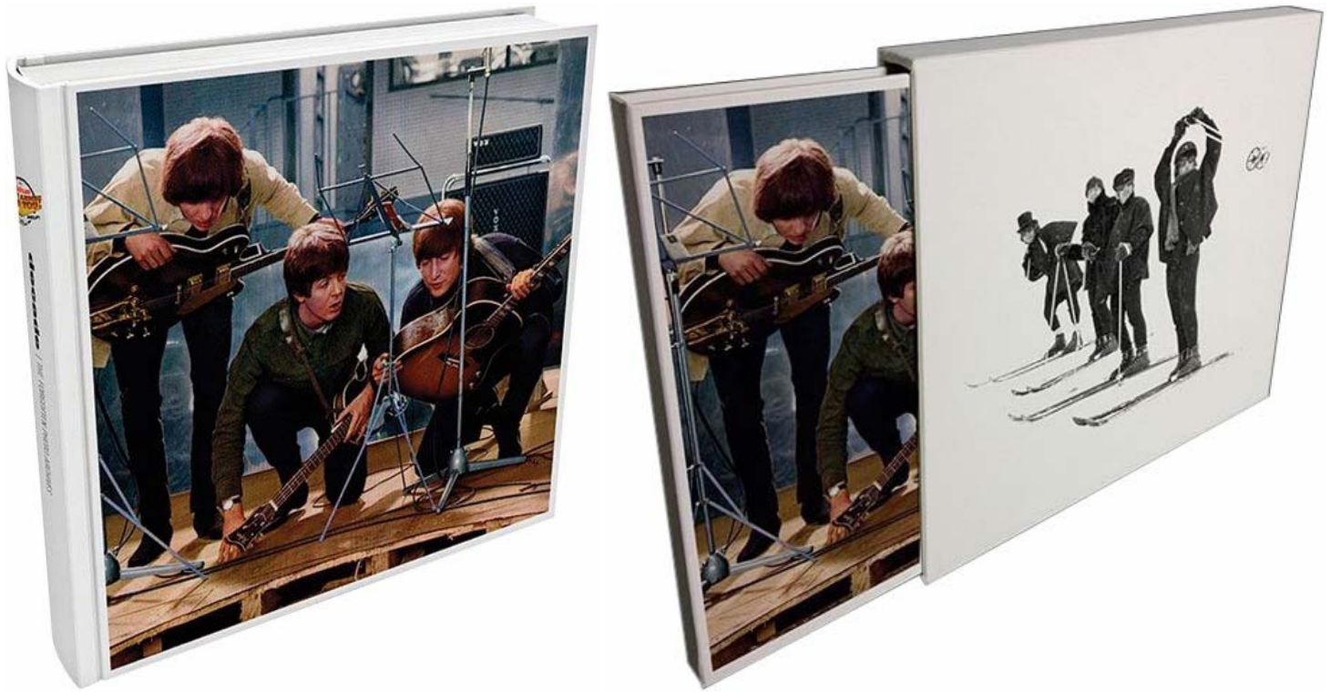
Abbildungen von links: Buch und Buch in Box.