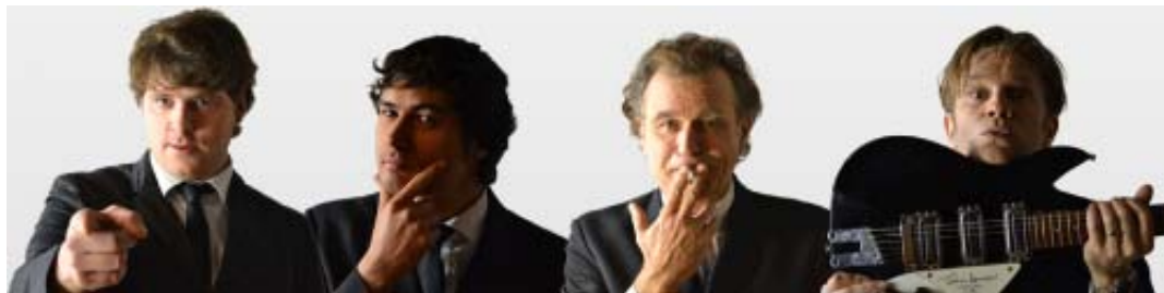
THE BEATLES REVIVAL BAND: ALLE KONZERTTERMINE (bitte anklicken)