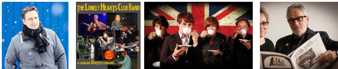
ANDREAS GEFFARTH: ALLE KONZERTTERMINE (bitte anklicken)