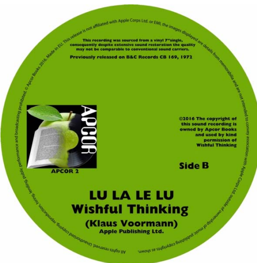
Abbildungen von links: Vinyl-Single-Cover (Vorderseite) und -Rückseite sowie (proportional vergrößert): Label A-Seite und Label B-Seite

Juni 2016: KLAUS VOORMANN / WISHFUL THINKING: