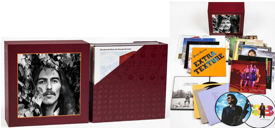
Abbildungen: LP-Box mit herausgezogenem Schubler und Inhalt der LP-Box (verkleinert dargestellt);

Freitag, 24. März 2017: PAUL McCARTNEY: Box (3 CDs, 1 DVD, 3 Bücher, 1 DownloadCard) FLOWERS IN THE DIRT (deluxe book edition). 124,95 Euro