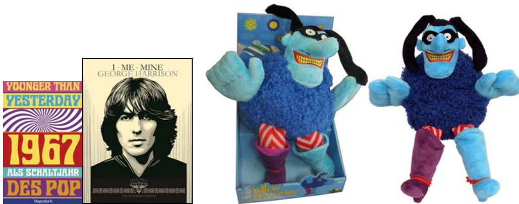
Abbildungen „Blue Meanie“: Figur mit Display und ohne.