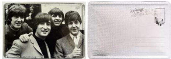
Abbildungen: Vorder- und Rückseite der Blechpostkarte

Neu: Wähle, ob wir Dir künftig per DPD oder DHL zusenden sollen.