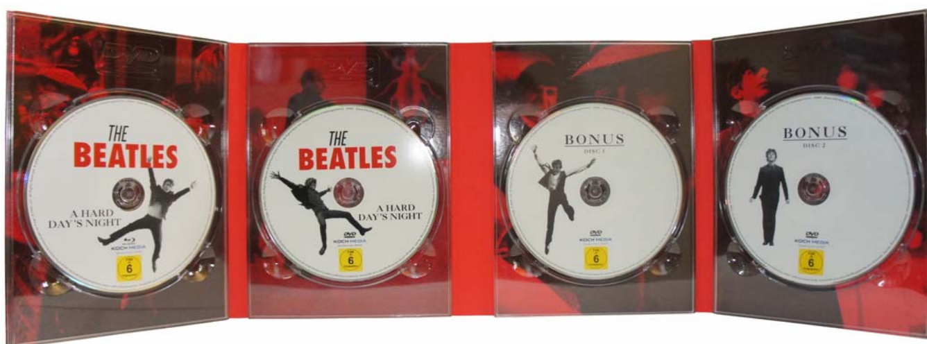
Abbildungen: Box von vorne und aufgeklappt.