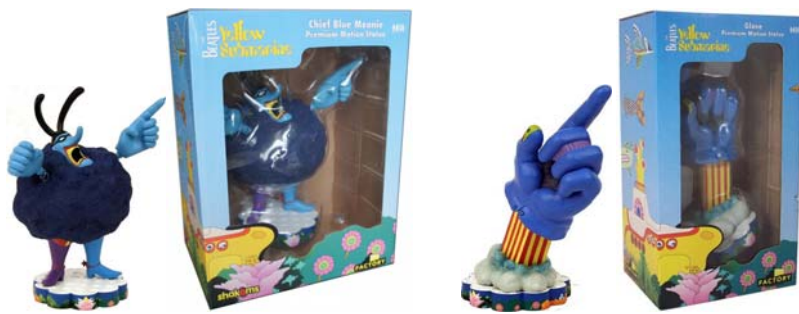
Figur CHIEF BLUE MEANIE PREMIUM MOTION STATUE . 27,90 Euro MEHR INFO