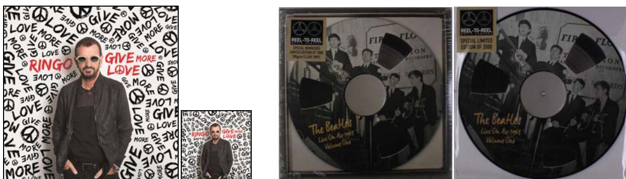
Freitag, 22. September 2017: RINGO STARR: Vinyl-LP GIVE MORE LOVE . 22,95 Euro MEHR INFO

Die von uns zugeschickten Bücher sind vom Autor signiert.