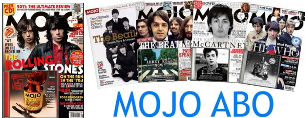
Abbildungen: von links; Das aktuelle Heft für Januar 2012; danach bereits erschienene Ausgaben (meist nicht mehr lieferbar)

Wir bekommen jeweils 10 Hefte von jeder Ausgabe von der englischen Musikzeitschrift MOJO . Das heißt: Wir können noch 8 Abonnements eintragen, und würden uns freuen, wenn Du dabei bist: pro Heft 13,50 Euro & 0,85 € Versand