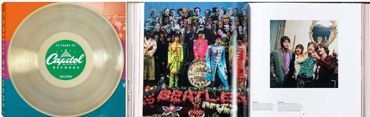
Abbildungen unten: Buch-Vorderseite, Doppelseite mit Beatles.

BEATLES-Longsleeve-Shirt SILHOUETTES ABBEY ROAD & LETTERING THE BEATLES ON LIGHT CREME. 29,50 € MEHR INFO