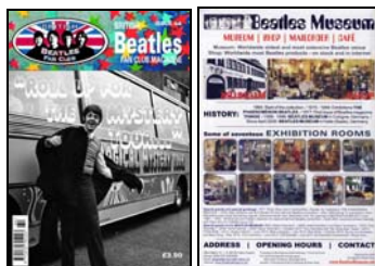
Abb.: BBFC 64 - Cover und Rückseite

DVD 10-MINUTE TEACHER - NORWEGIAN WOOD. 5,95 € MEHR INFO