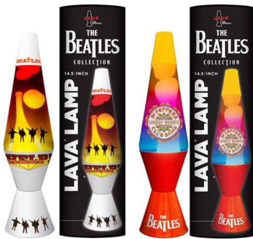
Abbildungen: jeweils Lava-Lampe und spezielle Box.

2015: BEATLES-Lava-Lampe HELP!. 79,90 € MEHR INFO