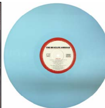
Abbildungen: Cover-Vorderseite, -Rückseite; Vinyl-Scheibe.