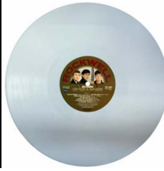
Abbildungen: Cover-Vorderseite, -Rückseite; Vinyl-Scheibe.