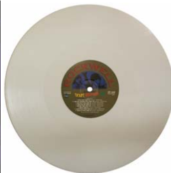
Abbildungen: Cover-Vorderseite, -Rückseite; Vinyl-Scheibe.