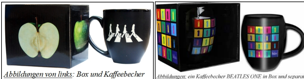
Abbildungen von links: Box und Kaffeebecher | Abbildungen: ein Kaffeebecher BEATLES ONE in Box und separat.

2013: "Bauchiger" BEATLES -Kaffeebecher YELLOW SUBMARINE BAND in spezieller Box. 9,50 Euro MEHR INFO 2014: "Bauchiger" BEATLES -Kaffeebecher LETTERING THE BEATLES WHITE ON BLACK in spezieller Box. 9,50 Euro MEHR INFO