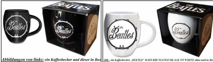
Abbildungen von links: ein Kaffeebecher und dieser in Box | Abb.: ein Kaffeebecher „BEETLE“ BASS DRUM LOGO BLACK ON WHITE ohne und in Box

Dienstag, 1. November 2016: BEATLES -Bausteine LEGO YELLOW SUBMARINE . 89,95 € MEHR INFO Lego, Dänemark.