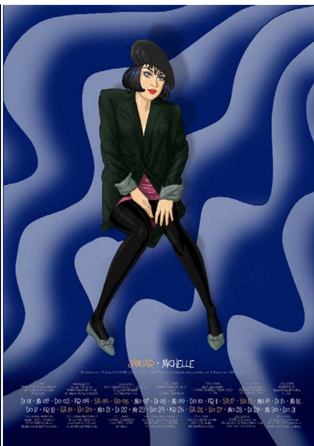
Abbildungen: Cover und Januar-Blatt (alle weiteren Abbildungen auf unserer Internetseite).