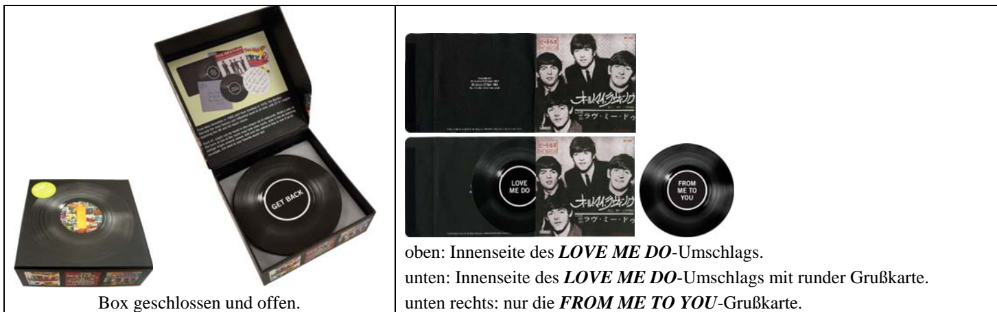
Box geschlossen und offen.