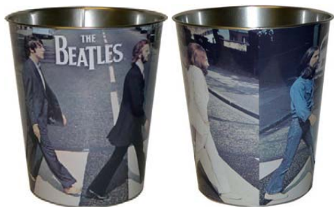
Abbildungen: ein Papierkorb von zwei Seiten

2015: THE BEATLES: Grußkarten-Set THE BEATLES # 1 SINGLE COLLECTION . 19,95 € MEHR INFO