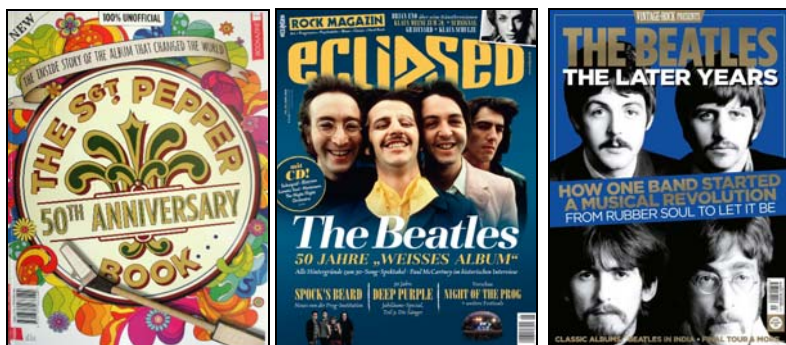
ca. Mai 2017: BEATLES-Paperback

THE BEATLES: Papierkorb aus Metall ABBEY ROAD COVER & LETTERING THE BEATLES . 14,90 € MEHR INFO