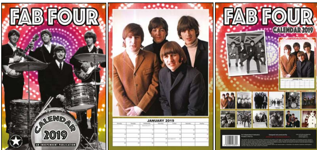
Abbildungen: Kalender-Vorderseite / Januar-Blatt / Rückseite mit Ausdruck aller zwölf Monatsmotive.

Mittwoch 6. Juni 2018: Paperback THE BEATLES - THE LATER YEARS. 18,50 € MEHR INFO