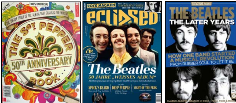
ca. Mai 2017: BEATLES -Paperback

Deutsches Kartenspiel THE BEATLES-QUIZ. 9,95 Euro MEHR INFO