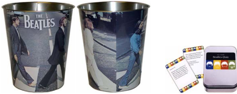
Abbildungen: ein Papierkorb von zwei Seiten

Samstag 21. April 2018: GARY CLARK JR. & JUNKIE XL: Vinyl-Maxisingle COME TOGETHER . 29,95 Euro MEHR INFO