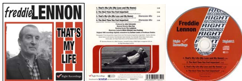
Abbildungen von links: CD-Cover-Vorderseite und -Rückseite sowie CD-Scheibe.

A-Seite: That's My Life (My Love And My Home) (mono) (Freddie Lennon / Tony Cartwright) (2:48). / B-Seite: The Next Time You Feel Important (mono) (Sidney Lippman / Sylvia Dee) (2:48).