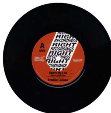
Abbildungen von links: Single-Cover-Vorderseite und -Rückseite sowie Single.

Mittwoch 22. August 2018: FREDDIE LENNON :