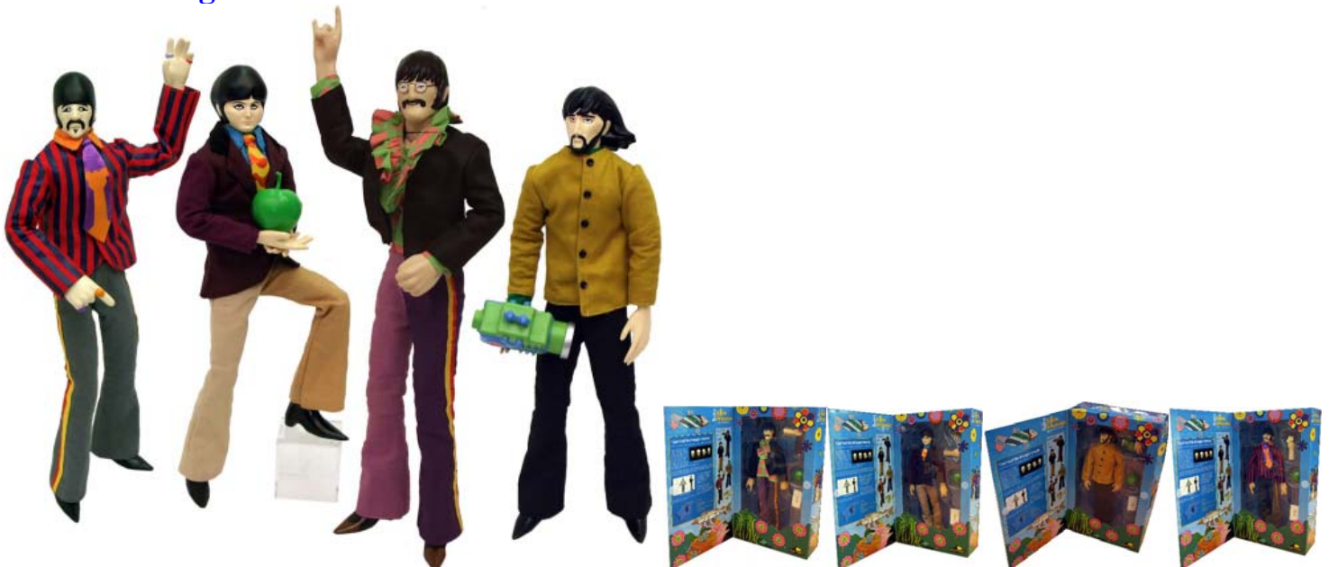
Abbildung von links: Figuren ohne Display; Figuren in den Präsentationsboxen (aus starkem Karton, sehr verkleinerte Abbildungen)

Sehr große Plastik-Figuren (33,5 cm hoch) mit Stoffkleidung JOHN, PAUL, GEORGE & RINGO YELLOW SUBMARINECOLLECTION SET . 449,00 € MEHR INFO