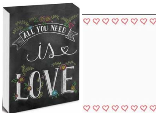
Abbildungen: Notizblock und eine einzelne Seite.