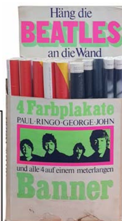
Abbildung: Die fünf einzelnen Postern. / verkleinerte Abbildung: Verkaufs-Display. WICHTIG: Verkaufs-Display nur zur Ansicht, gehört nicht zum Lieferumfang.