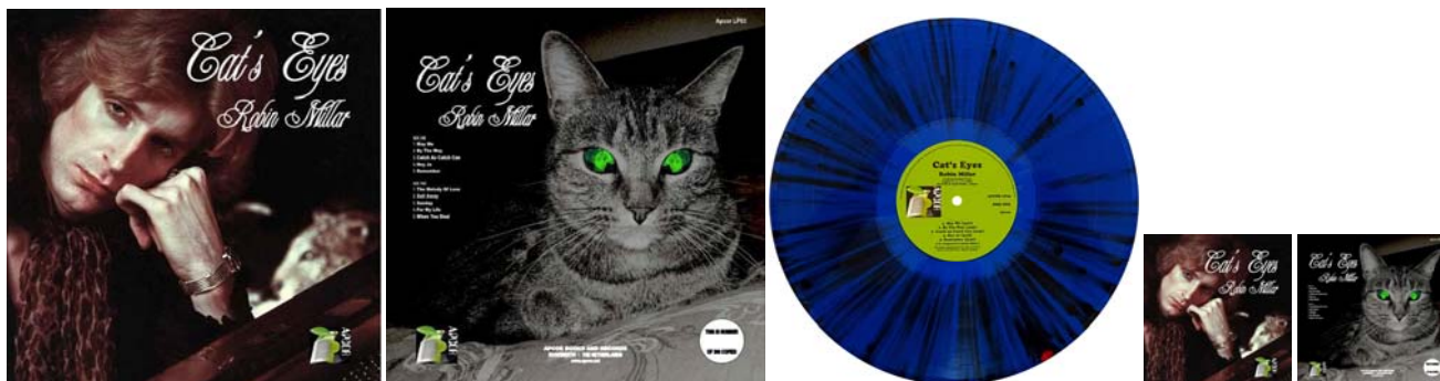
Abbildungen von links: LP-Cover-Vorderseite, -Rückseite und Blue-Splattered-Vinyl-LP / CD-Cover-Vorderseite und -Rückseite.

April 2019: ROBIN MILLAR : Blue-Splattered-Vinyl-LP im Klappcover CAT'S EYES (nur 300 Exemplare). 42,95 € MEHR INFO