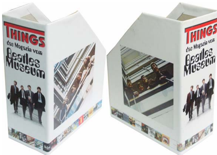
Abbildungen: THINGS-Stehordner, fotografiert von rechts und links