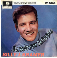
1.: BILLY J. KRAMER

... und im BEATLES-Magazin THINGS regelmäßig 50/40/30/20/10 YEARS AGO und die NEWS Ergänzungen und Korrekturen sind willkommen! #BeatlesMuseum /// www.Facebook.com/BeatlesMuseumInHalle