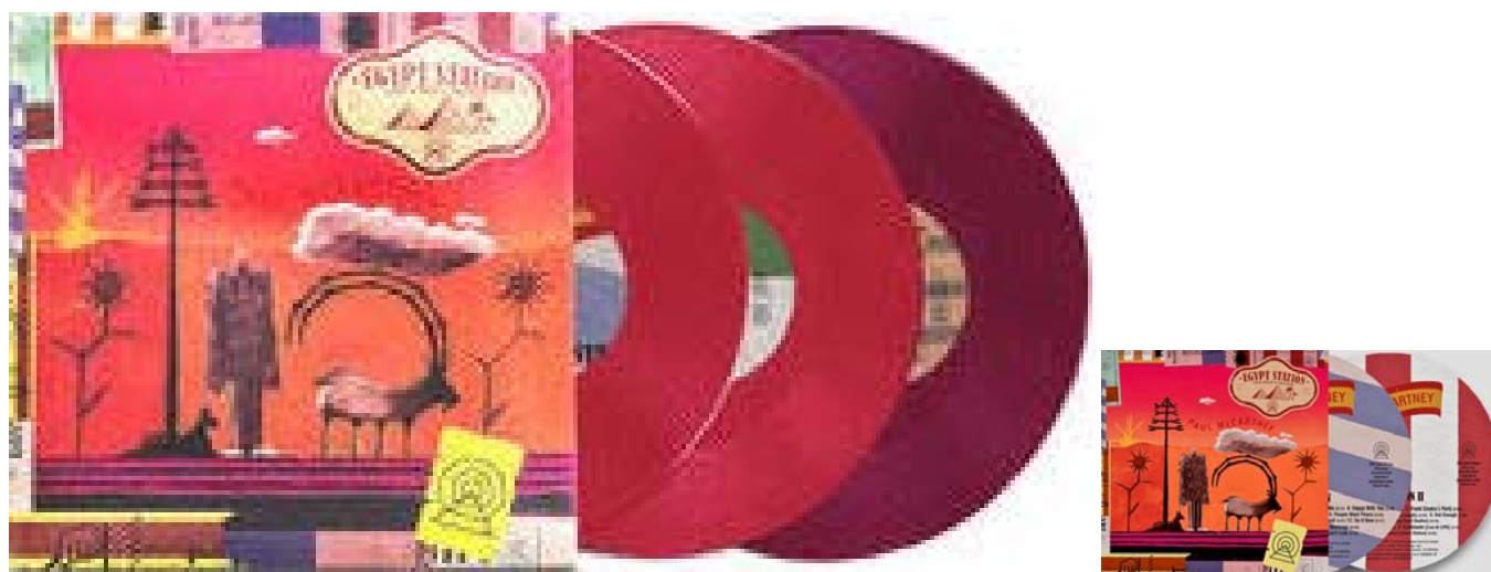
Abbildungen von links: 3er Colour-Vinyl-LP / Doppel-CD

Freitag 17. Mai 2019: PAUL McCARTNEY: 3er Colour-Vinyl-LP