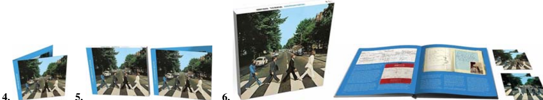
Abbildungen von links: CD / Doppel-CD / Box, Buch, 3 CDs und 1 Audio-Blu-ray

Produkt 1: 2019er 180g-Black-Vinyl-LP ABBEY ROAD ANNIVERSARY EDITION (NEW STEREO MIX) . 29,95 Euro MEHR INFO