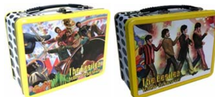
Abb. von links: Die Lunchbox YELLOW SUBMARINE von vorne/von hinten.