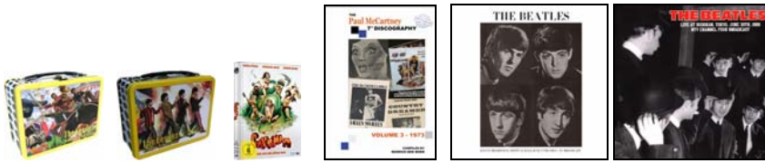
Abb. der Lunchboxen von links: von vorne und von hinten.

THE BEATLES: Lunchbox YELLOW SUBMARINE . 29,95 € MEHR INFO