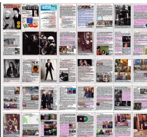
Abbildungen: Cover / Inhaltsverzeichnis / alle 40 Seiten (verkleinert)