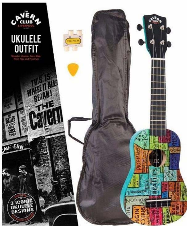
Abbildungen von links: Box, Stimmpeife und Pletrum, Tasche, Ukulele

Versenden wir zuverlässig mit DHL (Info über Sendeverlauf kommt per Email).