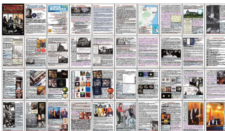
Abbildungen: Cover / Inhaltsverzeichnis / alle 40 Seiten (verkleinert)