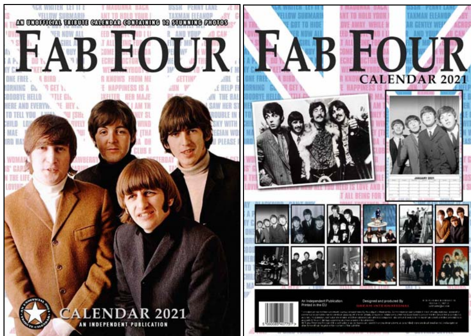
Abbildungen: Vorder- und Rückseite des 2021er Kalenders von Dream International.

plus zwölf Kalenderblätter mit Motiven aus den Jahren 1963 bis 1970 sowie zwei Solo-Beatles-Fotos (Lennon, McCartney).