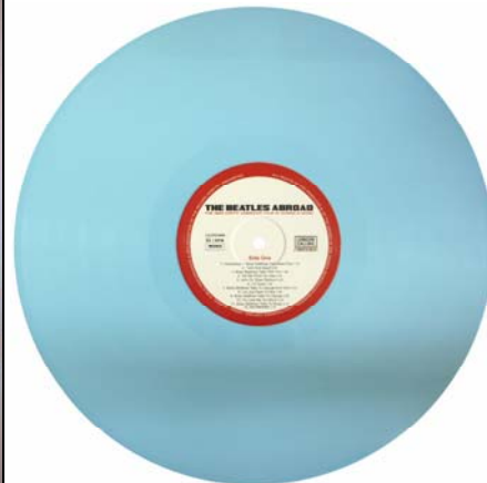
Abbildungen: Cover-Vorderseite, -Rückseite; Vinyl-Scheibe.