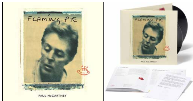
Abbildungen: Cover-Vorderseite / Doppel-LP mit Beilagen (verkleinerte Abbildung)

Produkt 5: 2020er Deluxe-Box (4 LPs, 5 CDs, 2 DVDs) FLAMING PIE .