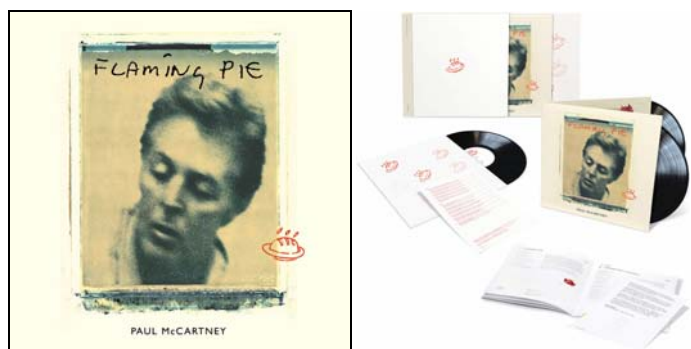
Abbildungen: Cover-Vorderseite / 3er LP mit Beilagen (verkleinerte Abbildung)

Doppel-LP remastered album , Seite 4: Track 11: Little Willow . / Track 12: Really Love You . / Track 13: Beautiful Night . / Track 14: Great Day .