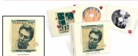
Abbildungen: Cover-Vorderseite / Doppel-CD ausgebreitet

Dritte LP home recordings , Seite 2: Track 20: Calico Skies (home recording) . / Track 21: Flaming Pie (home recording) . / Track 22: Souvenir (home recording) . / Track 23: Little Willow . / Track 24: Beautiful Night (1995 demo) . / Track 25: Great Day (home recording) .