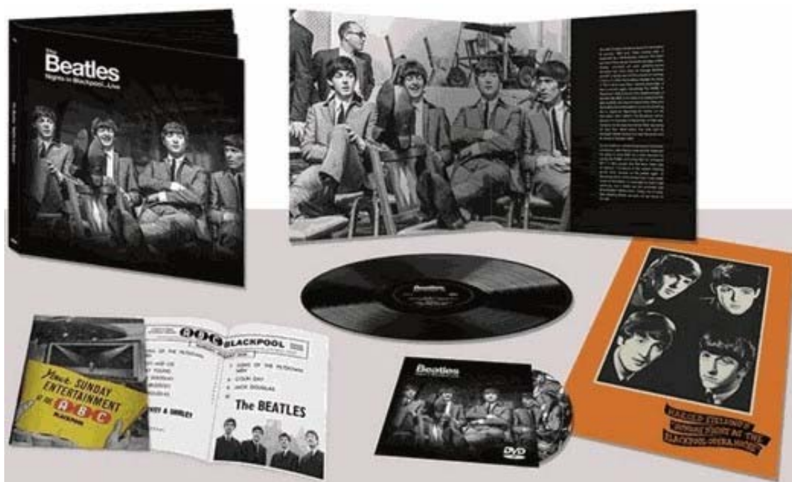
Abbildungen obere Reihe von links: Buch von vorne und aufgeklappt, davor 10inch-Vinyl-LP.