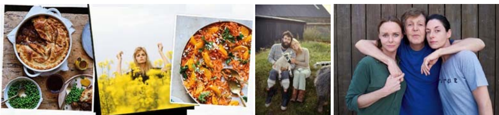
Abbildungen: Buch / Collage mit Gerichten / zwei Promotionfotos (aus dem Buch)