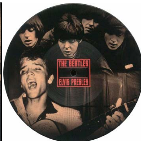
Abbildungen von links: Cover der White-Vinyl-Single / Picture Vinyl-Single THAT'S ALL RIGHT MAMA .

Freitag 26. November 2021: THE BEATLES / ELVIS PRESLEY: White-Vinyl-Single THAT'S ALL RIGHT MAMA . 19,95 € MCPS Cover22, Europa / Nummeriert und limitiert auf 500 Stück.