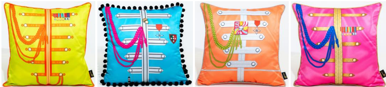
Abbildungen von links: PEPPER -Kissen JOHN / PAUL / GEORGE / RINGO .

Hinweis: Die Produkte stammen von der britischen Künstlerin Lindsay Kirkcaldy, alle Produkte sind handgefertigt und in Großbritannien hergestellt.