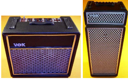
Abb. von links: Verstärker VOX AC 30 & Verstärker VOX T 100 .