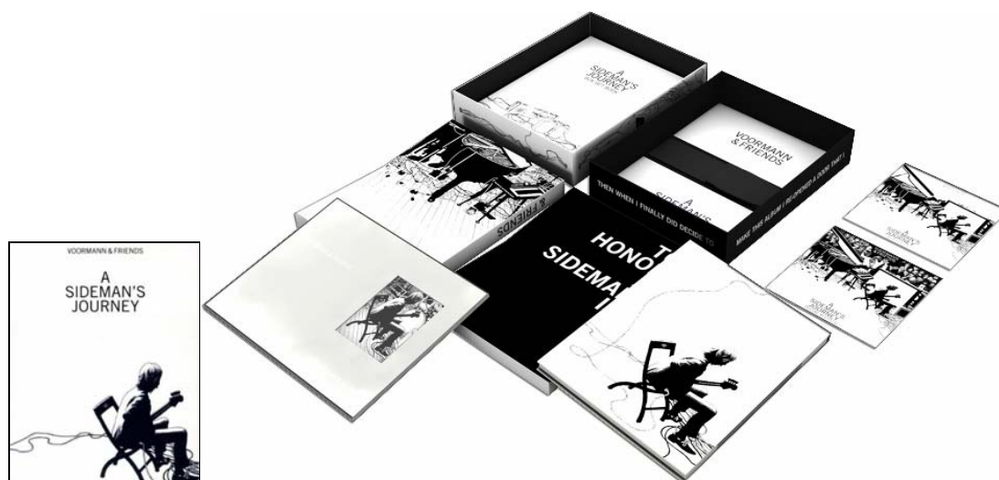
Abbildungen: Box-Vorderseite und aufgeklappte, ausgebreitete Box

Schwarz auf weiß, 100 % Baumwolle; in den Größen L und XL vorrätig.