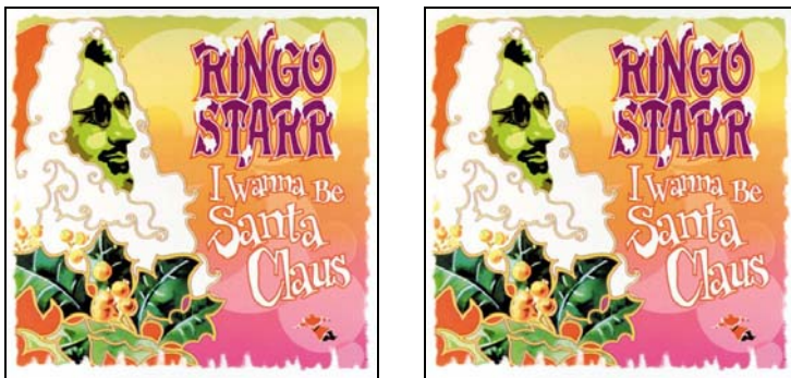
Abbildung links: I WANNA BESANTA CLAUS aus den USA. / Abbildung rechts: I WANNA BESANTA CLAUS aus den USA.

2008: KLAUS VOORMANN: T-Shirt A SIDEMAN'S JOURNAL BLACK ON WHITE. 39,90 € Schwarz auf weiß, 100 % Baumwolle; in den Größen L und XL vorrätig.