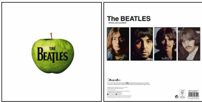
Abbildungen: Vorder- und Rückseite der Hülle für Kalender (gestaltet wie ein LP-Cover).

Kalender THE FAB FOUR 2018 CALENDAR - WHITE ALBUM . 13,50 Euro MEHR INFO