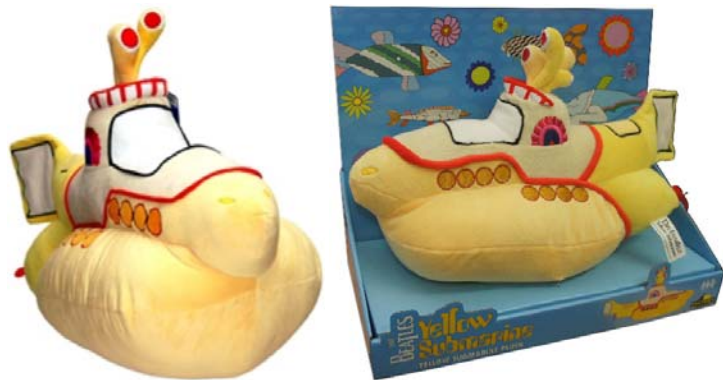
2012: große Stoff-Figur YELLOW SUBMARINE PLUSH COLLECTION . 24,90 €