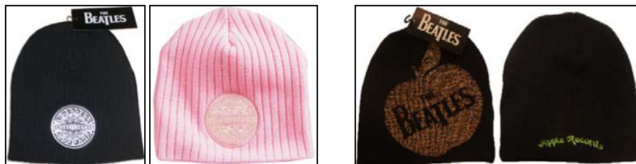
BEATLES-Wollmütze schwarz mit gesticktem, aufgenähtem Schwarzweiß-Emblem SGT. PEPPER . 14,50 €