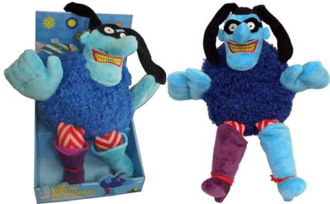
große Stoff-Figur CHIEF BLUE MEANIE PLUSH COLLECTION . 24,90 €

Ausführliche Informationen und/oder Bestellung: Einfach Abbildung anklicken