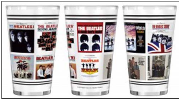
Abbildungen: ein BEATLES-Glas von drei Seiten

Januar 2014: Großes BEATLES-Glas THE FIRST U.S. VISIT. 22,90 € Format: 14,8 cm hoch; 8,7 cm Durchmesser; Volumen: ca. 0,4 l