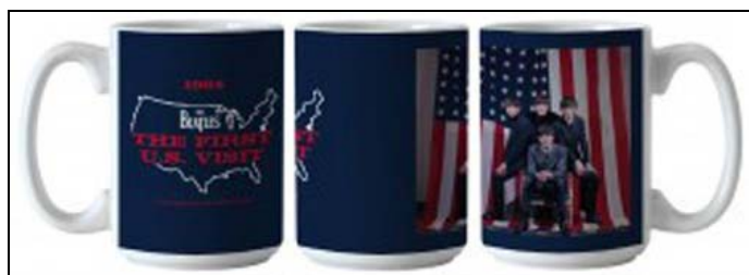
Abbildungen: ein BEATLES -Kaffebecher von drei Seiten

In diesem Fall würden wir das laufende THINGS oder THINGS+TICKET um 25 Ausgaben verlängern und den Betrag in Höhe von 64,00 (sixty-four) € abbuchen.