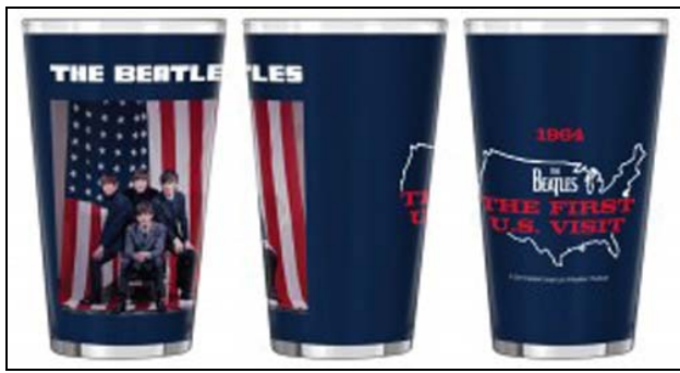
Abbildungen: ein BEATLES-Glas von drei Seiten

Januar 2014: Großes BEATLES-Glas THE FIRST U.S. VISIT. 22,90 € Format: 14,8 cm hoch; 8,7 cm Durchmesser; Volumen: ca. 0,4 l