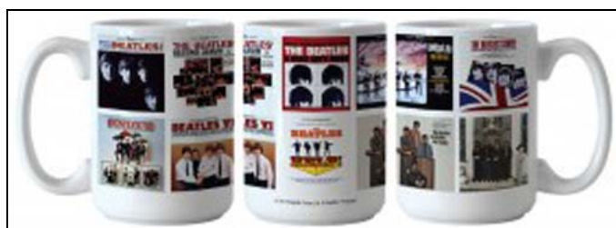
Abbildungen: ein BEATLES -Kaffebecher von drei Seiten

Format: 11,5 cm hoch; 8,1 cm Durchmesser; Volumen: ca. 0,4 l