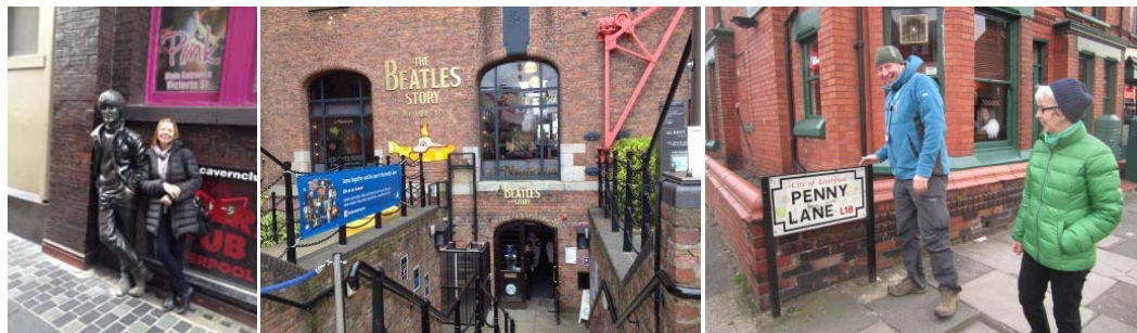
Foto links: Das kann sich keiner verkneifen: einmal in der Matthew Street neben John ...

Wer Interesse hat, meldet sich am besten über die Mail-Adresse: dr.eberlein@web.de