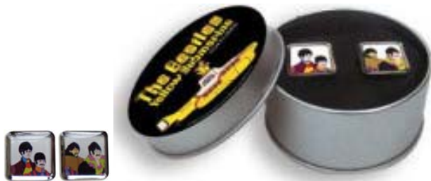
Abbildungen von links: Manschettenknöpfe ca. 2 cm x 2 cm; Deckel der Metallbox und Manschettenknöpfe in Box.