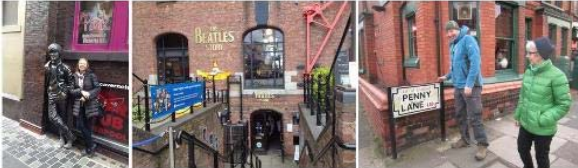
Foto links: Das kann sich keiner verkneifen: einmal in der Matthew Street neben John ...

SONDERPREISE FÜR M.B.M.s - bitte beim Veranstalter erfragen.