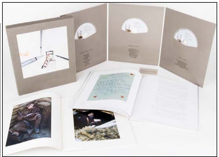
Abbildungen: verkleinert im Vergleich zu anderen Abbildungen.

Freitag, 2. Oktober 2015: PAUL McCARTNEY : Box (Schuber) TUG OF WAR (deluxe) . 99,00 Euro mit 3 CDs, 1 DVD, 112-Seiten-Buch, 64-Seiten-Scrapbook, Download-Card für TUG OF WAR (remixed 2015) und TUG OF WAR (bonus) .