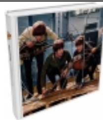
Buch THE BEATLES - EIGHT ARMS TO HOLD YOU - 50 YEARS HELP! (OPEN EDITON) Preis wird noch mitgeteilt