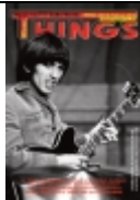
BEATLES-Magazin THINGS 263 €3,75 inkl. Versand