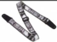
BEATLES-Gitarrengurt BEATLES IN THE STUDIO 1965 €32,90