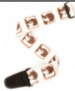
BEATLES-Gitarrengurt A HARD DAY'S NIGHT €32,90