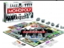
BRETTSPIEL THE BEATLES MONOPOLY in deutsch €39,95